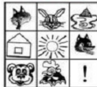
Лиса и Заяц