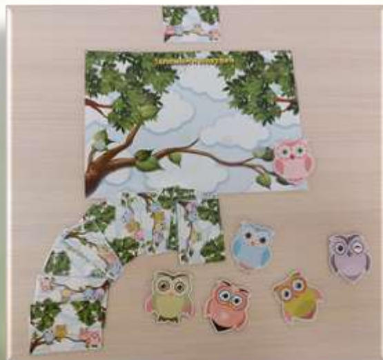
«Совушки» Запомни и повтори