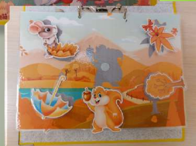
Тематический альбом «Осенние заплатаки»