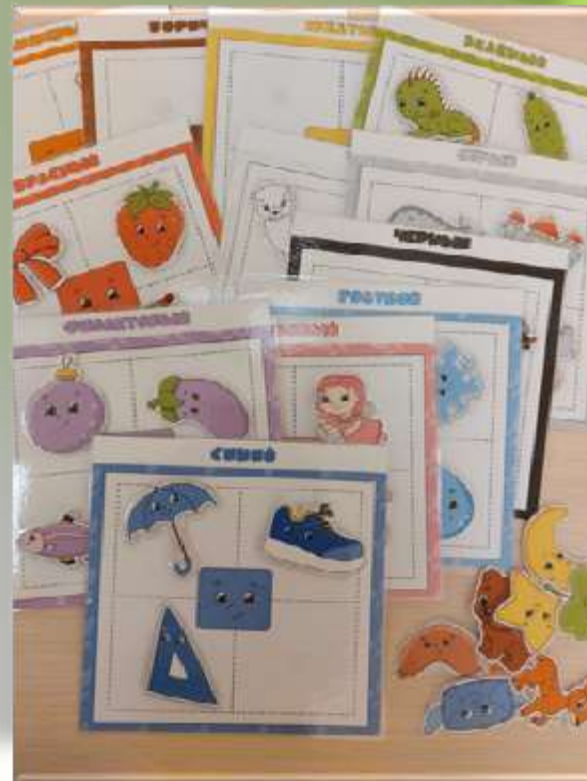
Игра «Подбери по цвету»