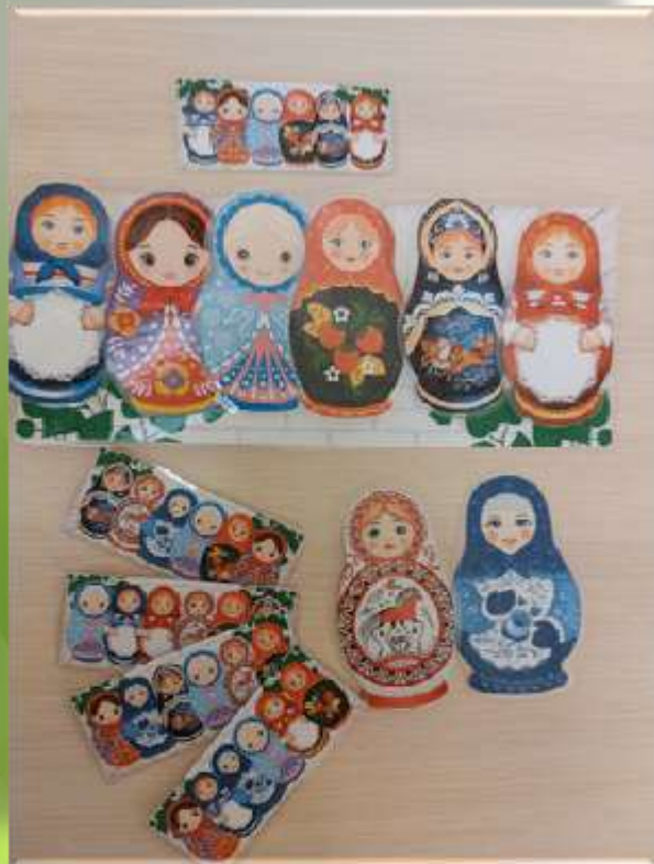
«Собери матрешек по образцу»

Целью данных практических пособий является развитие всех сторон речи, начиная от закрепления правильного звукопроизношения и заканчивая работой по формированию связной речи. Упражнения, предлагаемые детям, помогают не только устранять речевые нарушения, но и способствуют формированию внимания, памяти, повышают работоспособность, развивают мелкую моторику, активизируют мыслительные операции, готовят детей к школе.