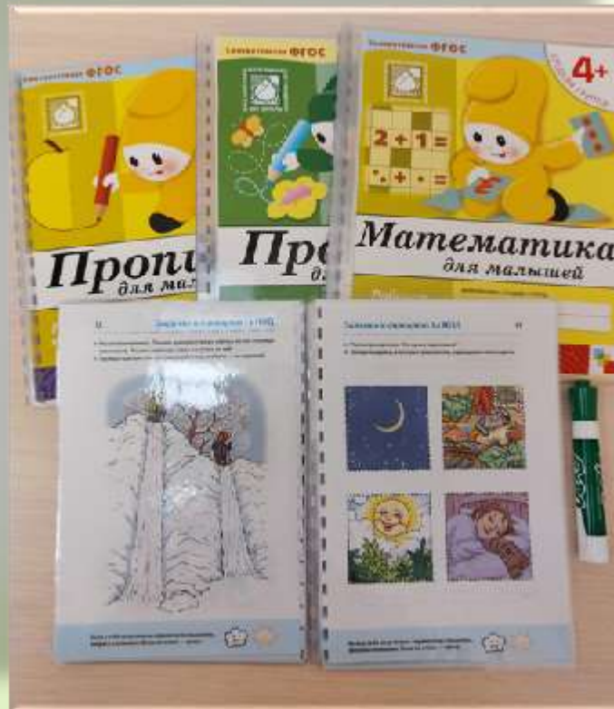
Тетради «Пиши стирай»