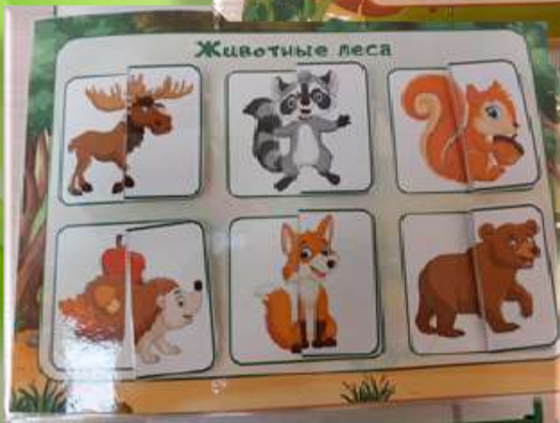
Тематический альбом «Половинки»