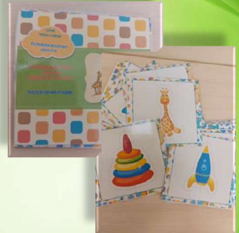
Тетрадь «Рисуем двумя руками»