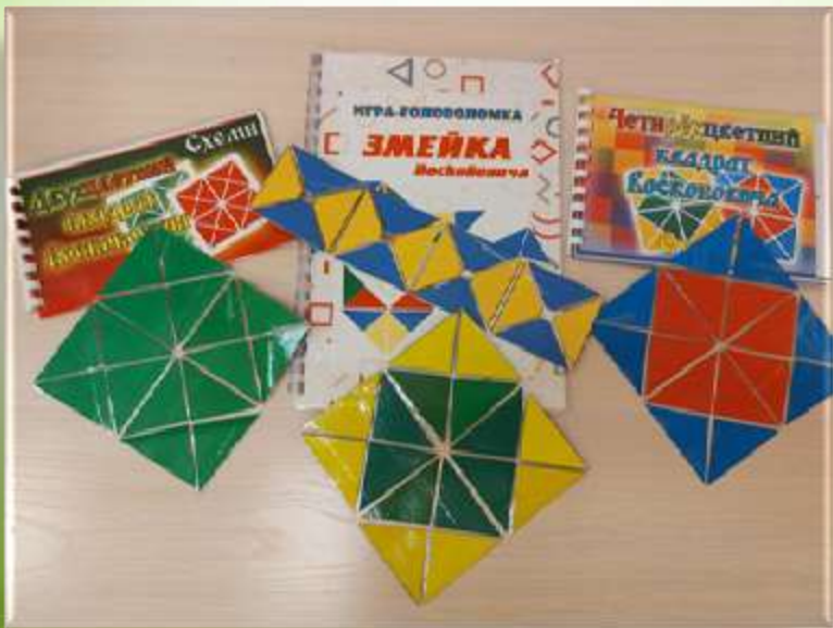
Квадраты и змейка Воскобовича