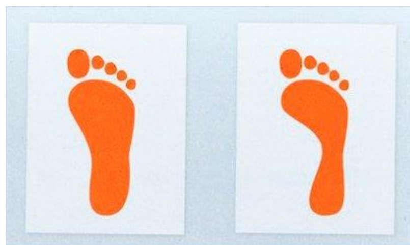
Стопа с плоскостопием

Нормальная или плоская стопа? Определить форму стопы можно так: смазать стопы ребенка подсолнечным маслом и поставить его на лист белой бумаги, хорошо впитывающей масло. При этом надо отвлечь внимание малыша. Через 1—1,5 минуты снять его с бумаги и внимательно рассмотреть отпечатки стоп. Если следы имеют форму боба, то это свидетельствует о нормальных стопах: своды стоп приподняты и при движениях выполняют рессорную функцию. Если же отпечаталась вся стопа, следует заподозрить имеющееся или начинающееся плоскостопие, а если дошкольник при длительной ходьбе жалуется на боль в ногах, то здесь уже нужна консультация и помощь ортопеда.