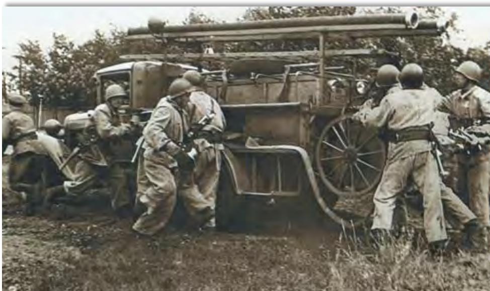
Воины-пожарные ликвидируют последствия налетов фашистской авиации на Москву, 1941г.

Произошло 322 пожара погибло на пожарах 14 человек, получили травмы на пожарах 17 человек, в том числе травмированы 3 ребенка.